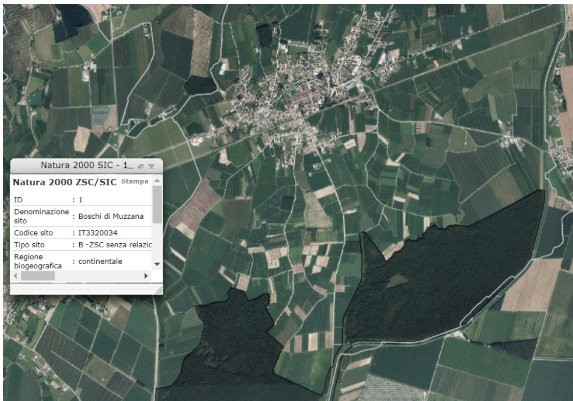
Fig 1. ZSC/SIC/ZPS del Comune di Muzzana del Turgnano evidenziati con ombreggiatura nera , distanti ca. 1,5 km dal nucleo storico di Muzzana oggetto di PAC ( Irdat FVG, 2018, mod. )